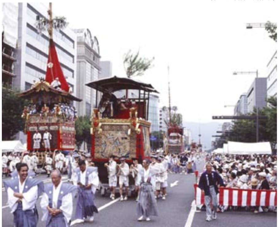
現代の巡行風景（平成19年）

しかしながら、江戸の天下祭の例、京都祇園祭の例、と見てきましたように、祭にかぎらず、踊り、歌謡、芝居等、庶民が営々と運営して参りました伝統的な無形文化などというのは、一朝、社会的、政治的大変動に遭遇するや、たちまちその濁流に巻き込まれて簡単に消滅してしまうような存在に過ぎないのです。このようなことが、とりわけ戦後、全国的に多数生じてきたことはみなさまご承知の通りだと思います。