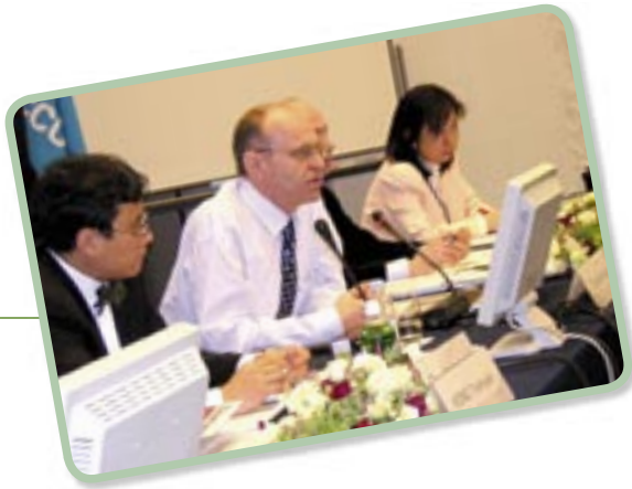
ACCUとユネスコ共催による無形遺産条約専門家会合(2006年3月)にて(中央)