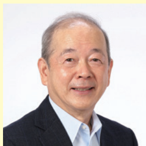
ゲスト 宮川 秀俊 愛知教育大学名誉教授