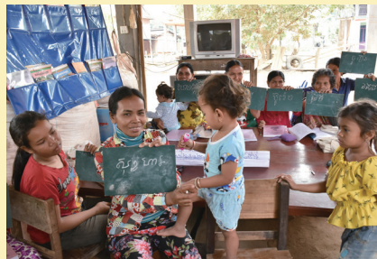
識字教室で学習するカンボジアの女性たち

カンボジアでは、2008年に開始し2021年までに66の村で、1,410人以上の女性が参加しています。