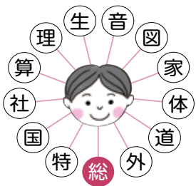
ESD対応教科・領域 小学3年

江東区立東雲小学校は、東京都の臨海部に学区域をもつ。学区域内にある東京国際交流館からは外国籍の子どもが多数通学しており、江東区内唯一の日本語学級が設置されている。この事例はこうしたバックグラウンドに加え、とある子どもの発言がその発端となった。「学校に来た〇〇ちゃんのお母さんが、学校の中で迷っていたよ!」「外国の人って、漢字読むの難しいんじゃない?」