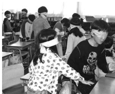
目かくしをしてユニバーサルデザインの必要性を実感する

パナソニックセンターの見学を行った際、子どもたちは、世の中には視覚(色覚)障害の人も多数いるということを知りてきている。その時に得た知見はのちに「学校のフロアの色には緑色と水色を入れたけど、これだと明るさが同じくらいだから、違いが分からない人がいるかもしれない」