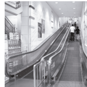
児童に例示したオートスロープ