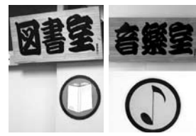
児童が工夫し、校内に掲示したピクトサイン